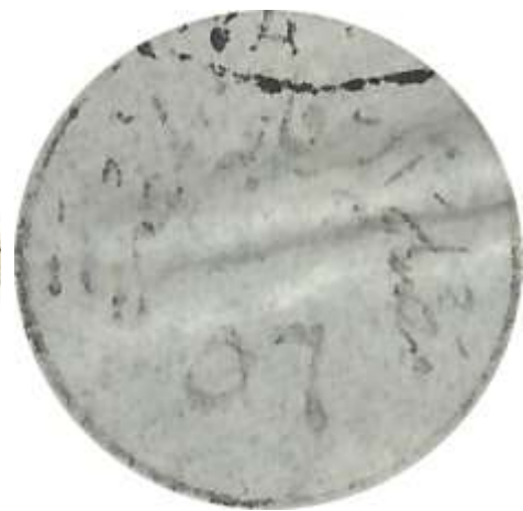
המכתב מבאנוס איידס

בתום הבדיקה נאטמו המכתבים באמצעות סרט דביק.