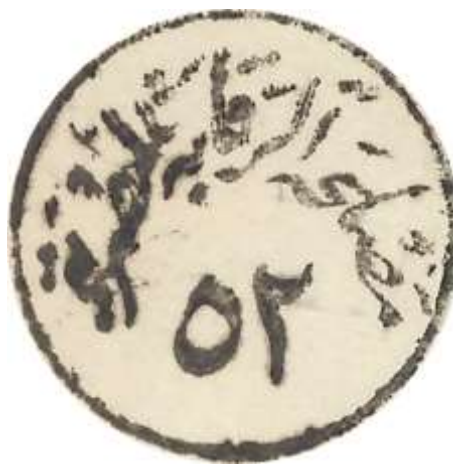
המכתב מניו יורק