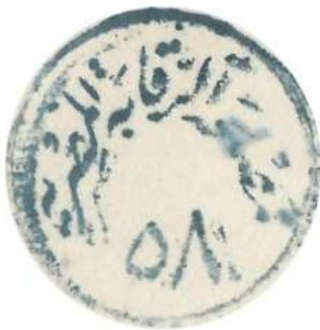
המכתב מסן פרנסיסקו

המכתבים שהוחרמו על ידי המצרים הועברו לידי הצנזורה הצבאית, אשר פתחה את המכתבים והחבילות ובדקה את תוכנם. על כל אחת מן המעטפות שנבדקו הוטבעה החותמת המזהה את הצנזור שביצע את הבדיקה.